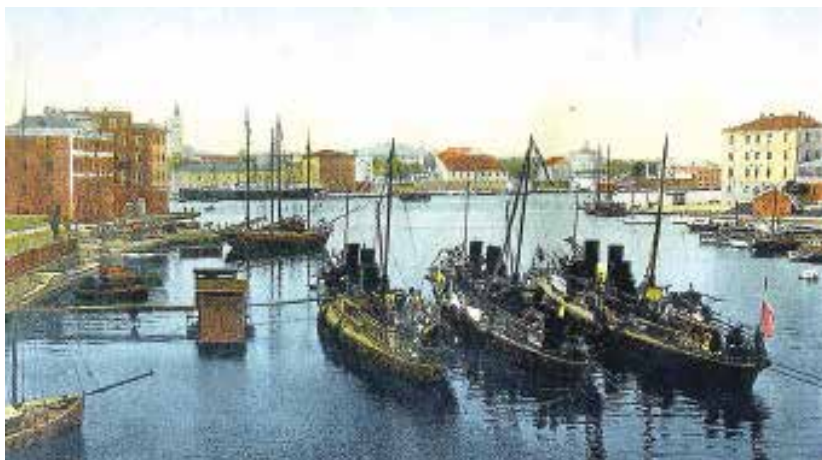
Val di Bora nel 1913 era la base navale per le torpediniere austriache