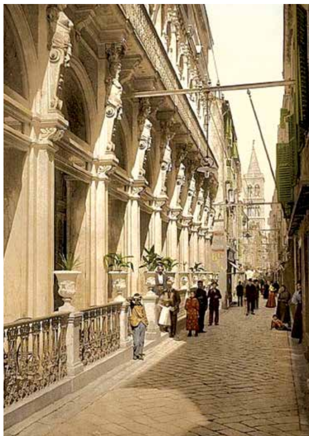
Calle Larga com'era