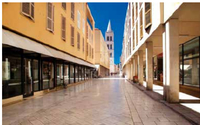
Un'immagine della Calle Larga deserta

Il primo caso in assoluto riscontrato a Zara. Spalato la città dalmata più colpita Epidemia contenuta, ma la crisi economica si farà sentire