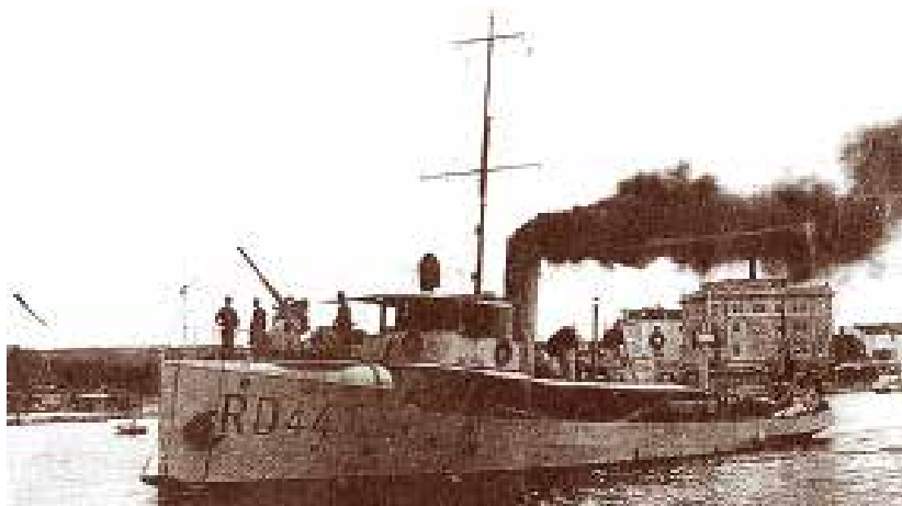
La "RD 44", che con la TP "Giovannini" era stanziata in Val di Bora a Zara durante la Seconda guerra mondiale, alternandosi con le similari "RD 19" e TP "Del Greco"

Dalle foto si comprende bene che la Val di Bora ebbe un ruolo fondamentale nella vita della nostra città, anche considerando che alle spalle crebbe presto il Bosco dei Pini, traversato dalla limpida sorgente che in essa sfociava, mantenendo pulite le acque di tutto il porto. Si costruirono le rive del suo perimetro e sorsero case e ville, la strada si completò col ponte "Corrado Tamajo" sopra il ruscello, consentendo il collegamento tra Ceraria e Barcagno. L'ultima nave che lasciò Zara dopo l'armistizio dell'8 settembre 1943 fu la TP "Giovannini". Oggi il mare della valle non si vede perché è totalmente coperto dalle barche della nuova Marina e grossi yacht anche stranieri. L'accesso, a ponente, è stato parzialmente ristretto da una piccola diga che lo protegge dai venti a volte impetuosi di quel quadrante.