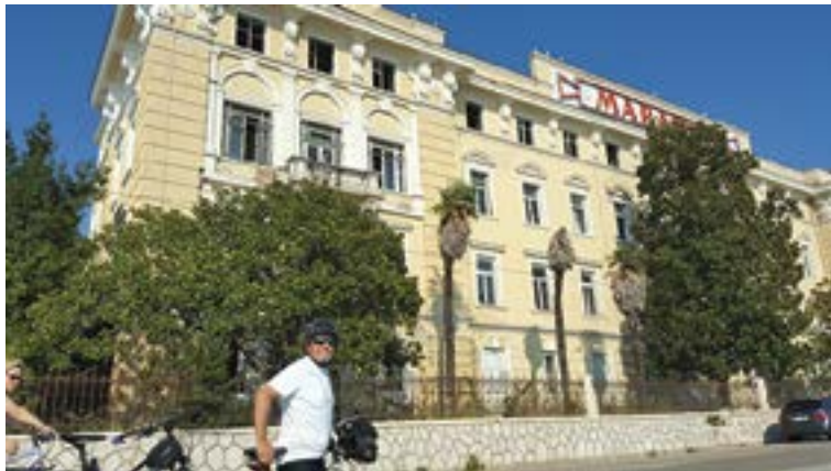
Lo stabilimento Luxardo

ficativo è stato osservare l'atteggiamento della comitiva intenta all'ascolto. Mai supino, bensì attento a cogliere, approfondire e puntualizzare alcune "omissioni" o certi evidenti scivoloni storici (come i bombardamenti su Zara avvenuti "per sbaglio") che il giovane cicerone cercava di proporre nel corso della sua introduzione storica, un po' troppo sbilanciata e "croatocentrica". Il contraddittorio è stato pacato e gentile, ma serrato e senza sconti. E pure tante sono state le domande alla guida, alcune molto personali, riguardanti la sua origine, la storia della sua famiglia e le sue radici italiane. Il racconto, trasmesso con un leggero velo di pudore (dovuto forse più al timore che qualcuno potesse sentirlo, così almeno ci è parso) ma senza imbarazzo nei nostri confronti, ha infine rotto il tabù e ci ha restituito l'immagine di un esule mancato e integratosi quasi per necessità, che ci ha colpito per la somiglianza del suo vissuto familiare con le tante cronache ascoltate nelle fasi preparatorie del viaggio. È stato, direi, anche questo un momento importante e fortemente empatico della nostra visita.