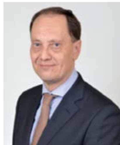
Il Sen. Luca Ciriani, eletto nel collegio del Friuli Venezia Giulia, capogruppo al Senato della Repubblica di Fratelli d'Italia

Mi permetto di ribaltare la questione. La strumentalizzazione è tale se ha la forza d'imporre la propria visione distorta. Mi riferisco a tutto quel mondo di sinistra ed estrema sinistra italiana che coglie ogni occasione per costruire una "storia" in cui gli italiani sono colpevoli di tutto e quindi meritevoli di ogni persecuzione. "C'è stato il Balkan quindi come stupirsi delle vendette delle foibe nel '43 e a guerra finita?" Voi conoscete perfettamente gli effetti di questo odio verso noi stessi e, seppure il Comunismo internazionalista non esista più, i giustificazionisti e negazionisti della tragedia orientale, in prima fila anche in questo caso, sono le volontarie o meno quinte colonne degli interessi stranieri in Italia. E se troppi italiani la pensano così, come facciamo a stupirci se gli sloveni fanno lo stesso o non ne approfittano?