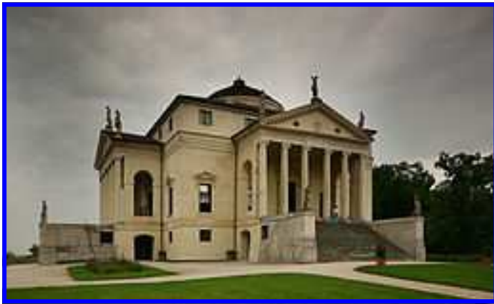
Villa La Rotonda