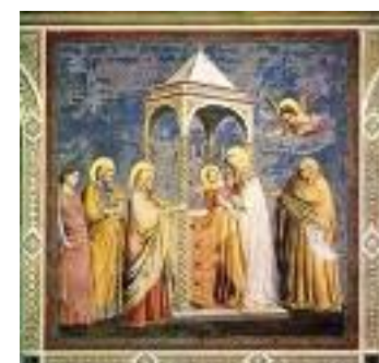
San Simone barbato con Gesù Bambino in braccio A COLORI, Giotto, Cappella degli Scrovegni, Padova