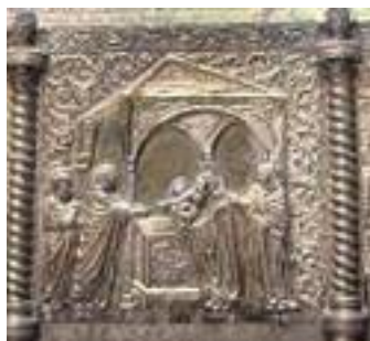
San Simeone barbato con Gesù Bambino in braccio SU FONDO ORO, è la cassa di Zara.

L’oggetto sacro più grande che ci sia a Zara, è l’arca di San Simone che contiene il corpo del Santo. La figura di quest’arca si trova in tutte le locandine turistiche.