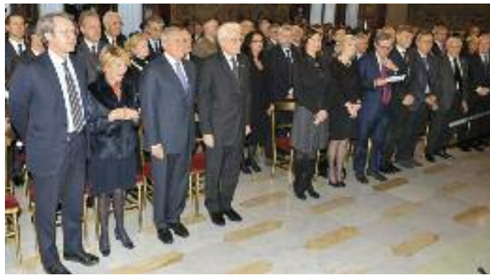
Il Presidente della Repubblica Sergio Mattarella assiste alla cerimonia del Giorno del Ricordo a Montecitorio