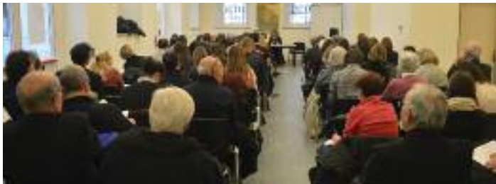
La sala Arturi Vigini gremita di pubblico

dalla letteratura medievale al futurismo e agli scrittori della diaspora dalmata e da Cherso a Ragusa e alle Bocche di Cattaro. Un pubblico vario e motivato ha così occupato per due giorni i diversi piani dell'IRCI, animati anche dalla stabile presenza di telecamere. Gli studiosi partecipanti si sono impegnati a consegnare subito il loro contributo per gli atti che usciranno quindi entro l'anno, costituendo un volume imponente che sarà la base di partenza per una futura storia della letteratura dalmata italiana.