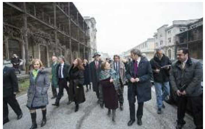
Il Ministro Benedetto Della Vedova durante la visita al Magazzino 18