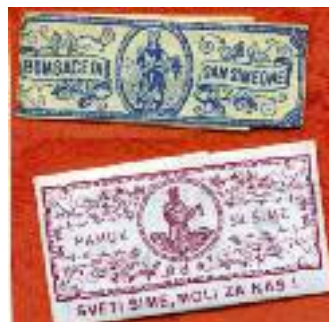
Bustine di “bombace” di San Simone: italiana(ieri) e croata (oggi).

Altre composizioni sono il salvataggio della nave dalla tem-